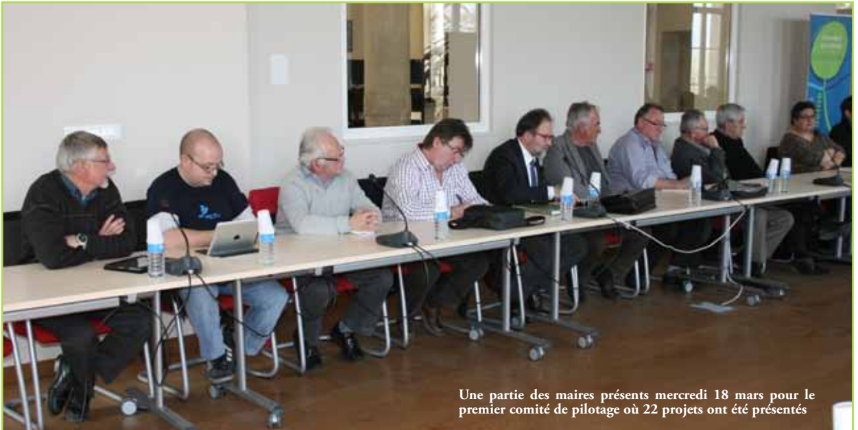
Une partie des maires présents mercredi 18 mars pour le premier comité de pilotage où 22 projets ont été présentés

Le schéma de mutualisation aura un objectif organisationnel en mettant en évidence les actions mutualisées possible entre la CCEMS et ses communes membres. Le pacte financier et fiscal sera en lien avec le schéma de mutualisation et fera état de la fiscalité déjà existante. Il cherchera de nouvelles relations possibles au sein du bloc intercommunal, tout en restant parfaitement imbriqué dans la volonté du projet politique.