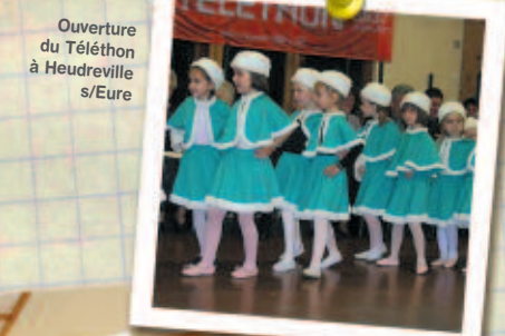
Ouverture du Téléthon à Heudreville s/Eure