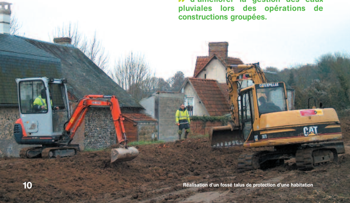
Réalisation d'un fossé talus de protection d'une habitation

Ses missions : procéder à un recensement de toutes les installations individuelles, avec visite chez les particuliers pour étudier et contrôler le fonctionnement de leur installation et les informer de la réglementation. Les informations recueillies devront faire l'objet d'un rapport, commune par commune et installation par installation, pour définir les priorités en terme de réhabilitation le cas échéant.