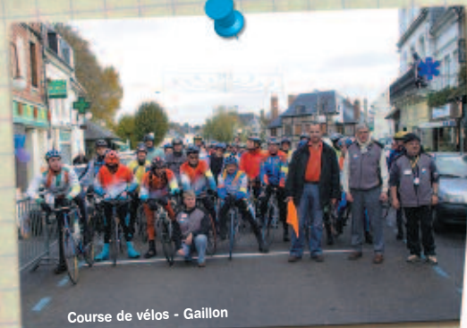
Course de vélos - Gaillon