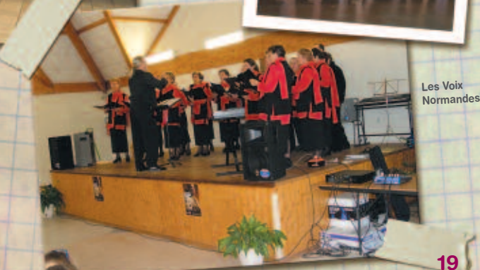
Les Voix Normandes