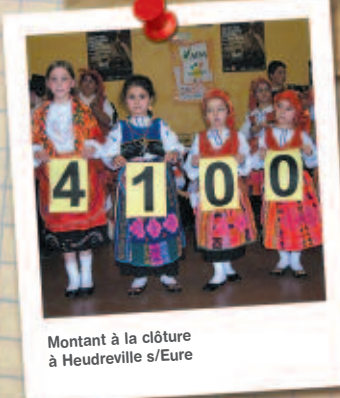
Montant à la clôture à Heudreville s/Eure