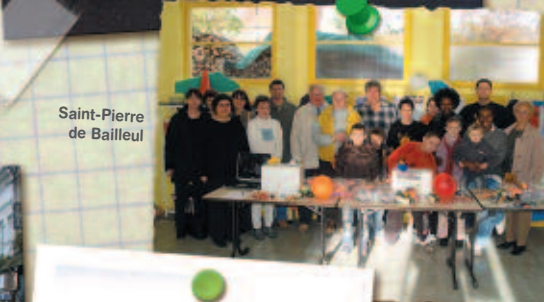
Saint-Pierre de Bailleul