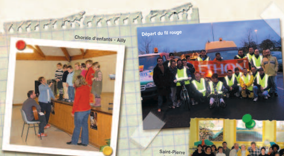
Chorale d'enfants - Ailly

En espérant n'avoir oublié personne... Merci à tous les participants !