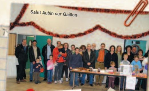
Saint Aubin sur Gaillon