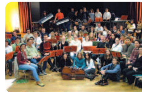
Orchestre vent et cordes