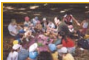
COURS SUR LA BOTANIQUE EN PLEINE NATURE